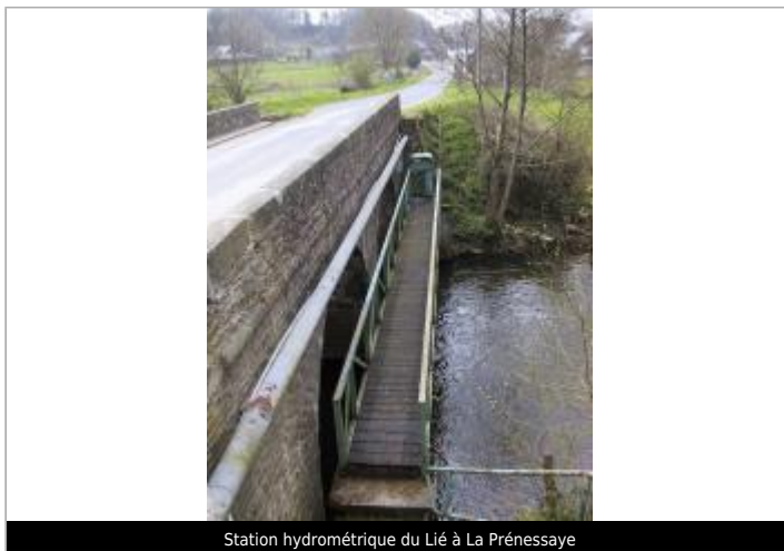
Station hydrométrique du Lié à La Prénessaye