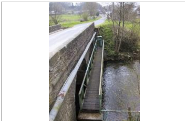
Station hydrométrique du Lié à La Prénessaye