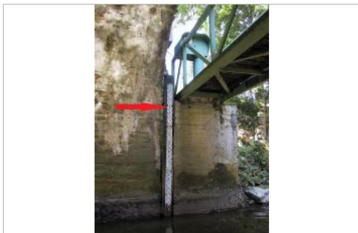
Echelle limnimétrique de la station du Lié à La Prénessaye

SOURCE DE REPÉRAGE : SPC VILAINE COTIERS BRETONS - 08/12/2016