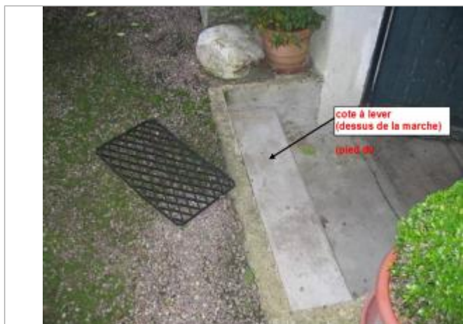
escalier d'accès à la cave de la maison

Altitude calculée de l'eau (en m) : 72.9 m