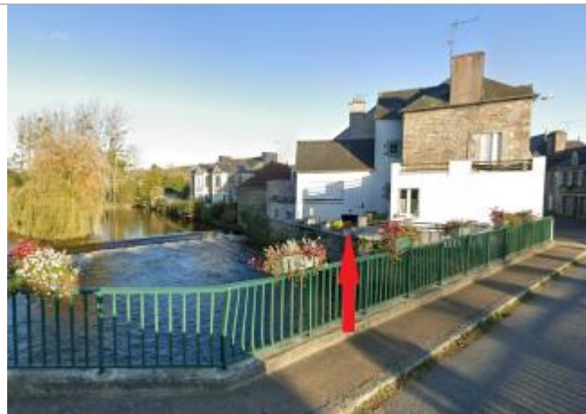
Maison au 1 rue de la Madeleine