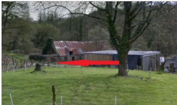
coté du bâtiment en ruine de l'ancien moulin