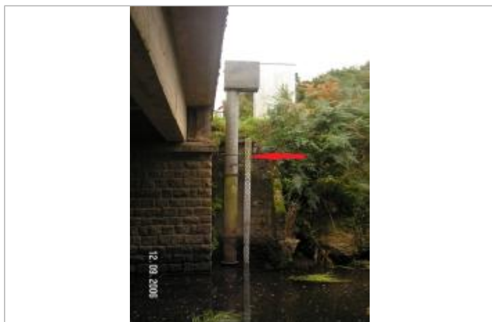
Echelle limnimétrique à la station de Trébrivan

Altitude calculée de l'eau (en m) : 91.143 m