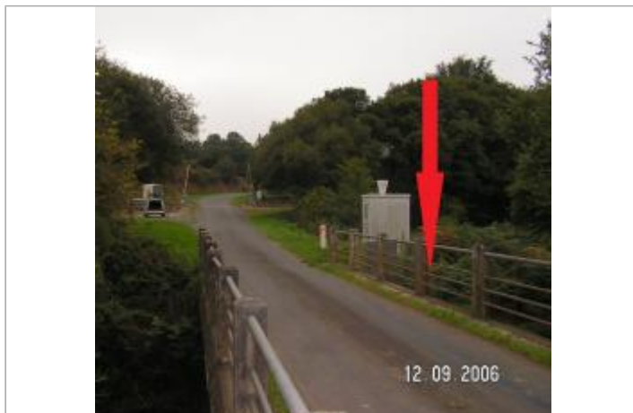
Station hydrométrique de l'Hyères à Trébrivan