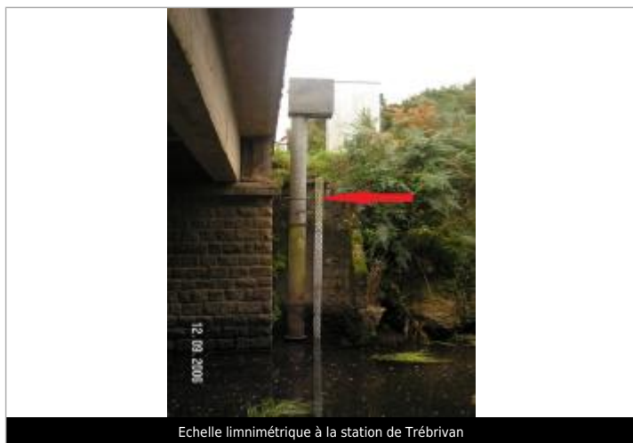
Echelle limnimétrique à la station de Trébrivan