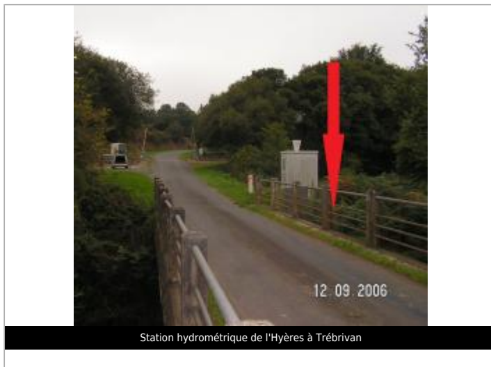
Station hydrométrique de l'Hyères à Trébrivan