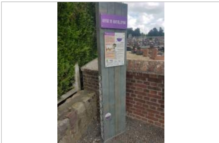
Pose d'un repère de ruissellement devant le cimetière de Limésy