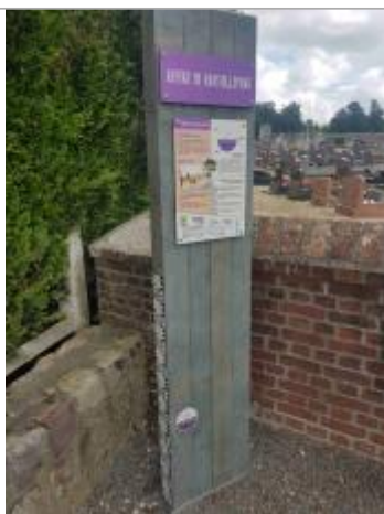
Pose d'un repère de ruissellement devant le cimetière de Limésy