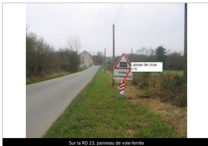
Sur la RD 23, panneau de voie-ferrée