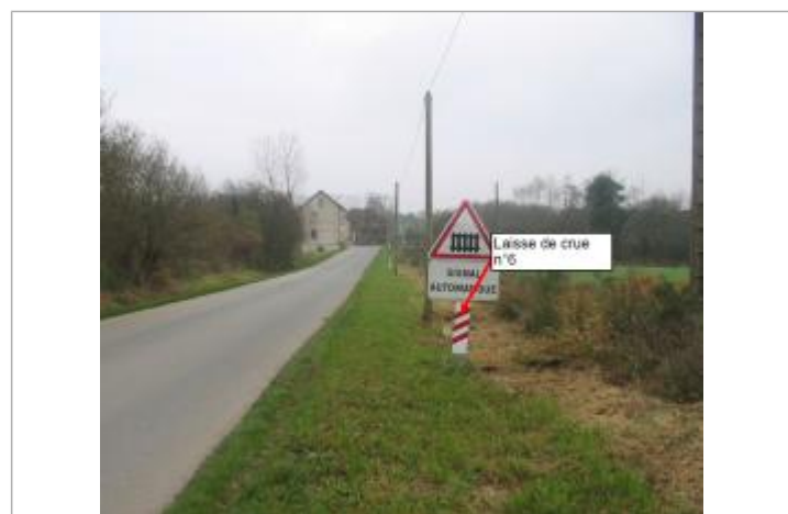
Troisième bande rouge en haut du panneau de voie-ferrée sur la RD 23