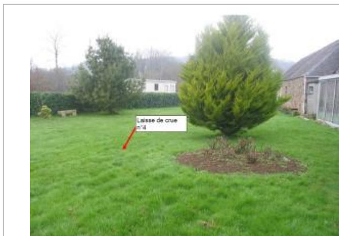
milieu du jardin de la maison d'habitation