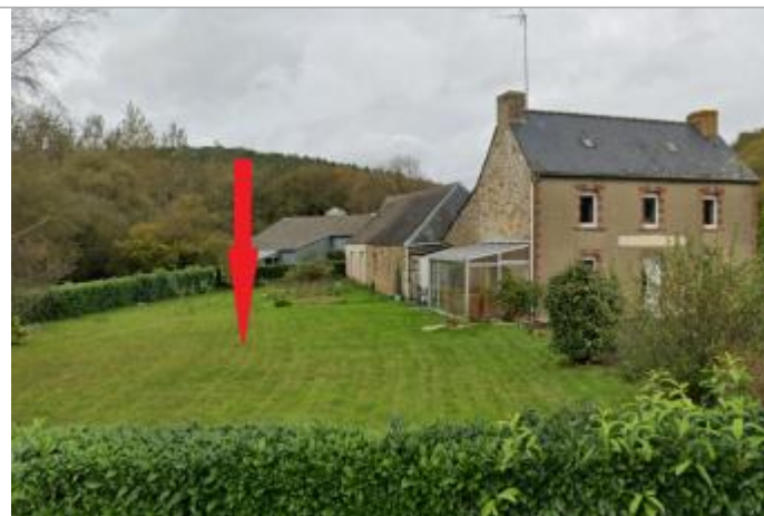
Jardin d'une maison au lieu-dit keramelin

Coordonnées WGS84 : X: -3.47664470 / Y: 48.36521440