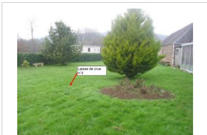
milieu du jardin de la maison d'habitation

Altitude calculée de l'eau (en m) : 106.65