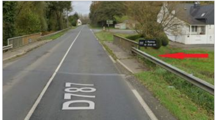
Pont de la RD 787 sur l'Hyères

Coordonnées WGS84 : X: -3.44515290 / Y: 48.38817590