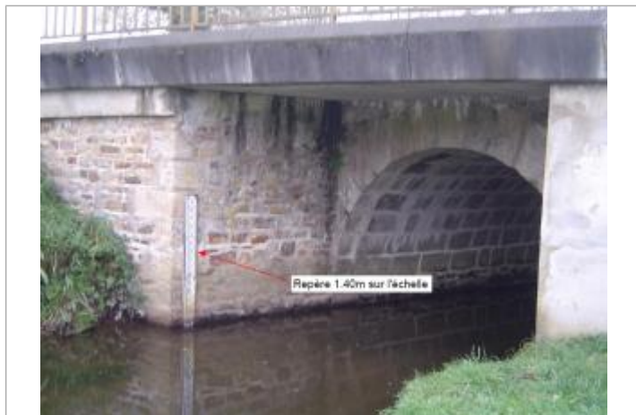
Echelle limnimétrique et repère de 2000

Altitude calculée de l'eau (en m) : 122.91 m