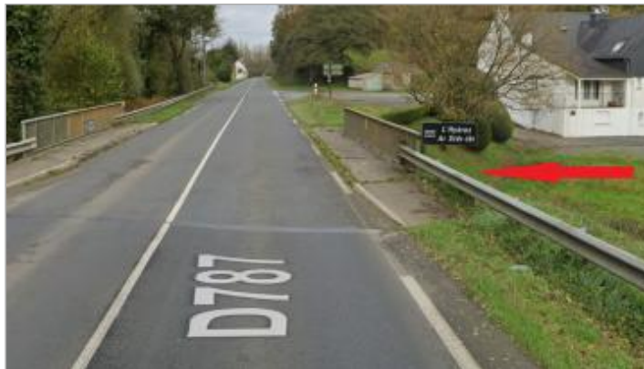
Pont de la RD 787 sur l'Hyères