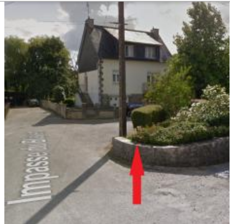
Dessus du muret au 3 impasse du Blavet

Coordonnées WGS84 : X: -3.17972230 / Y: 48.23227810