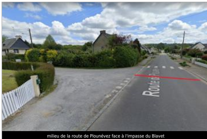
milieu de la route de Plounévez face à l'impasse du Blavet