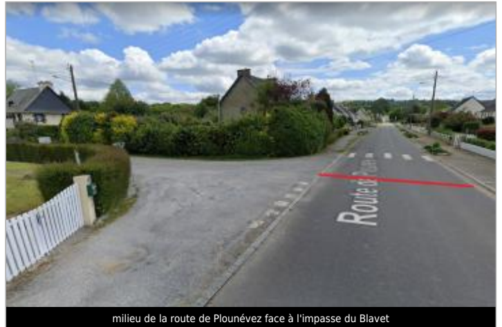
milieu de la route de Plounévez face à l'impasse du Blavet