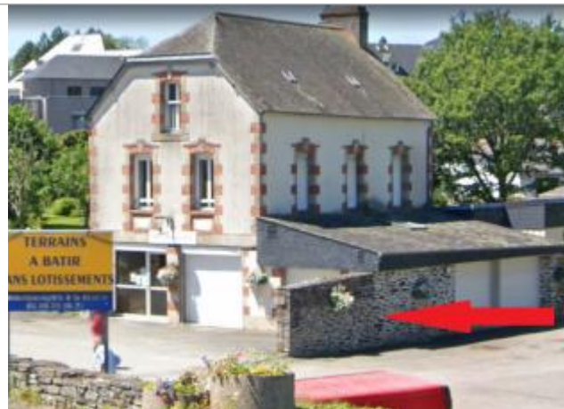
Salle polyvalente, angle du mur

Coordonnées WGS84 : X: -3.17852740 / Y: 48.22734760