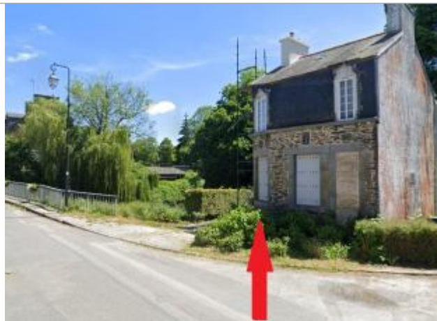
maison d'habitation au 22 rue de la gare