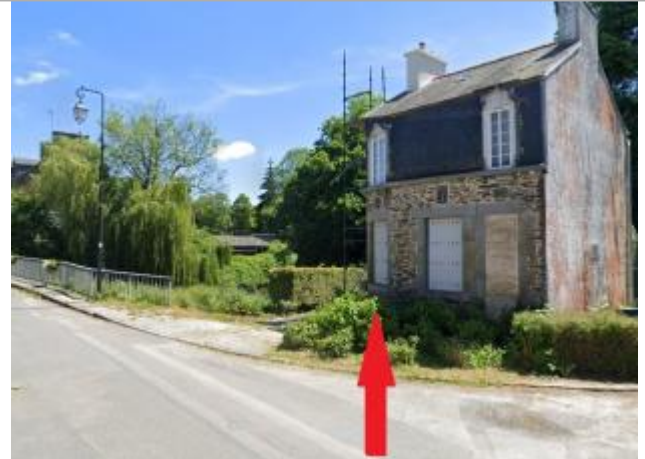
maison d'habitation au 22 rue de la gare