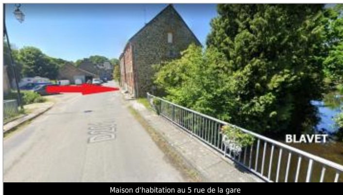
Maison d'habitation au 5 rue de la gare

Coordonnées WGS84 : X: -3.17718800 / Y: 48.22617990