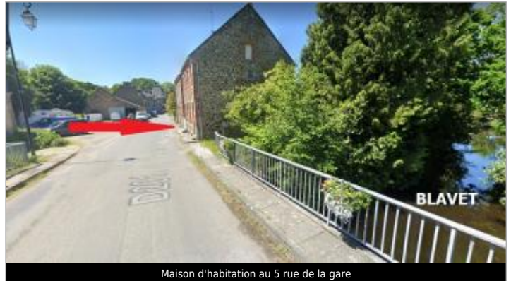
Maison d'habitation au 5 rue de la gare

Coordonnées WGS84 : X: -3.17718800 / Y: 48.22617990