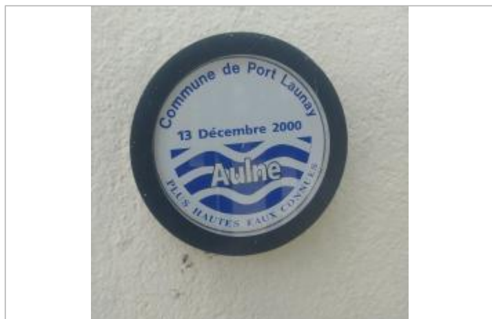
Repère de crue apposé sur le bâtiment