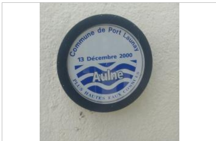
Repère de crue apposé sur le bâtiment

Texte : Commune de Port Launay Plus hautes eaux connues Aulne Maximum de l'inondation : Oui Visibilité : Oui État du repère : Bon Pérennité : Longue Repère calculé : Non PHEC : Oui