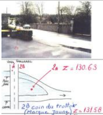
trottoir en amont du pont au dessus du "Petit Doré" coté Gouarec - croquis du relevé de 2003