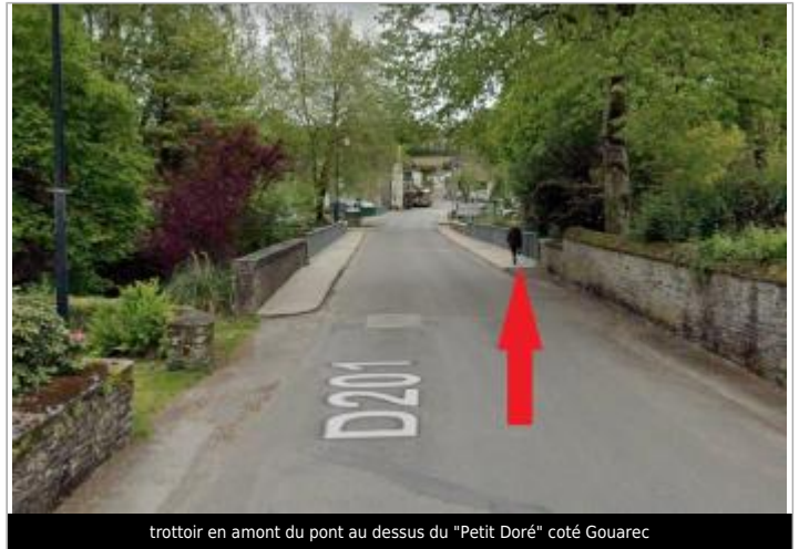
trottoir en amont du pont au dessus du "Petit Doré" coté Gouarec

Coordonnées WGS84 : X: -3.17842690 / Y: 48.22497140