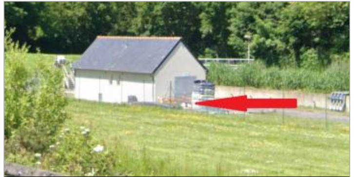
Station de pompage

Coordonnées WGS84 : X: -3.17477180 / Y: 48.22435320