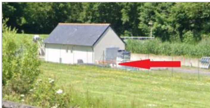
Station de pompage