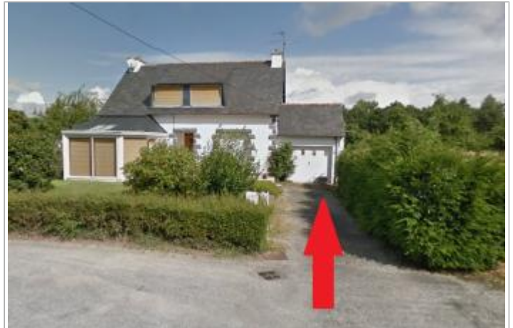
Maison d'habitation au 5 impasse du Blavet