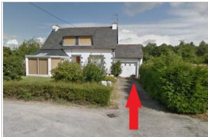
Maison d'habitation au 5 impasse du Blavet

Coordonnées WGS84 : X: -3.17957730 / Y: 48.23246640