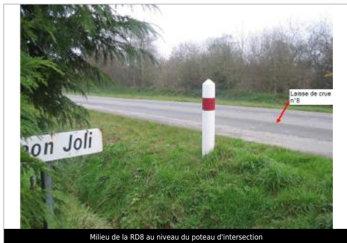
Milieu de la RD8 au niveau du poteau d'intersection

Altitude calculée de l'eau (en m) : 133.03