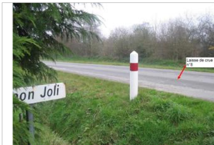
Milieu de la RD8 au niveau du poteau d'intersection

Altitude calculée de l'eau (en m) : 133.03