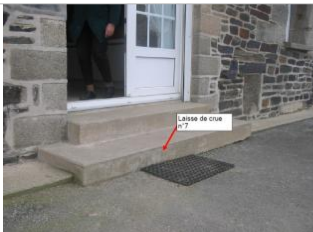
Dessus de la 1ère marche de la porte d'entrée de l'habitation

Altitude calculée de l'eau (en m) : 133.73