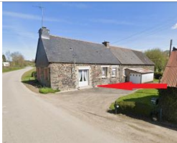
maison d'habitation dans le hameau Traou Blavet

Coordonnées WGS84 : X: -3.19132370 / Y: 48.24981110