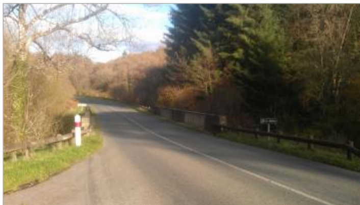
Ancienne station hydrométrique du Blavet à Plounevez-Quintin