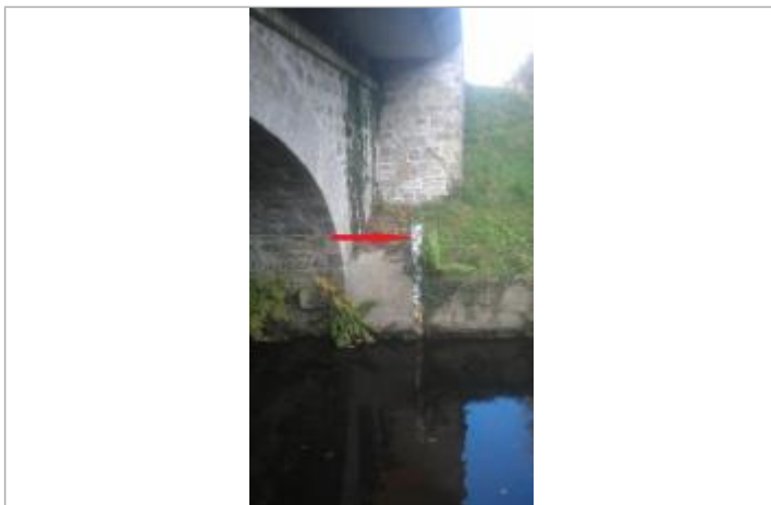
Echelle limnimétrique à l'ancienne station du Blavet à Plounevez-Quintin

Altitude calculée de l'eau (en m) : 164.81 m