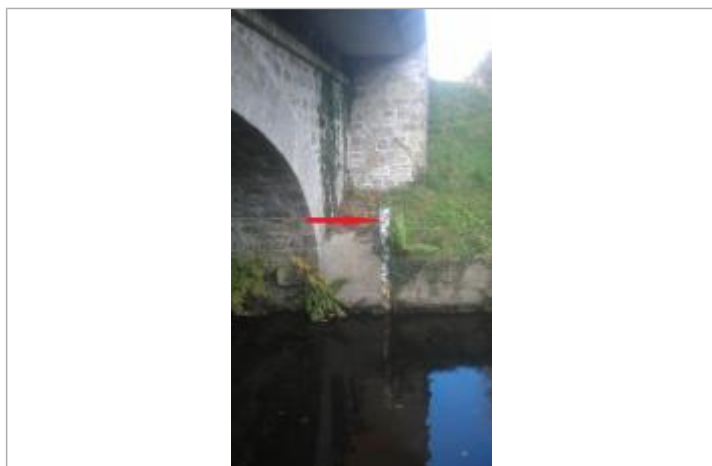
Echelle limnimétrique à l'ancienne station du Blavet à Plounevez-Quintin