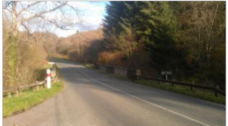
Ancienne station hydrométrique du Blavet à Plounevez-Quintin

Coordonnées WGS84 : X: -3.23455600 / Y: 48.32457740