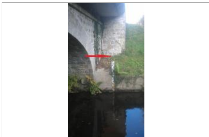
Echelle limnimétrique à l'ancienne station du Blavet à Plounevez-Quintin