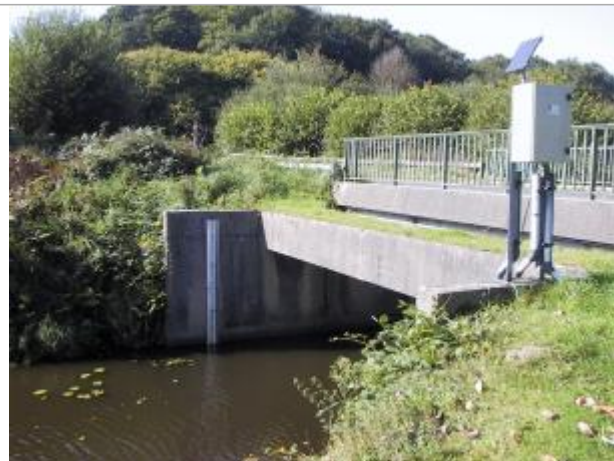
Station hydrométrique du Blavet à Lanrivain