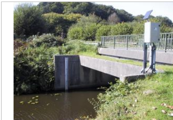
Station hydrométrique du Blavet à Lanrivain