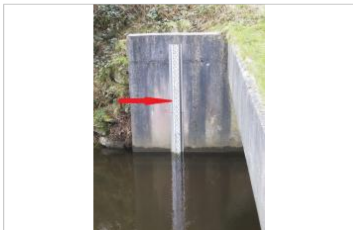
Echelle limnimétrique à la station du Blavet à Lanrivain

Altitude calculée de l'eau (en m) : 212.489 m