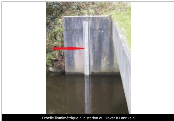
Echelle limnimétrique à la station du Blavet à Lanrivain

Altitude calculée de l'eau (en m) : 212.529 m