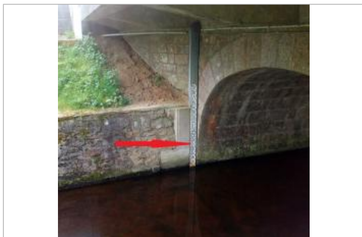
Echelle limnimétrique à la station du Blavet à Kérien

Altitude calculée de l'eau (en m) : 227.346 m