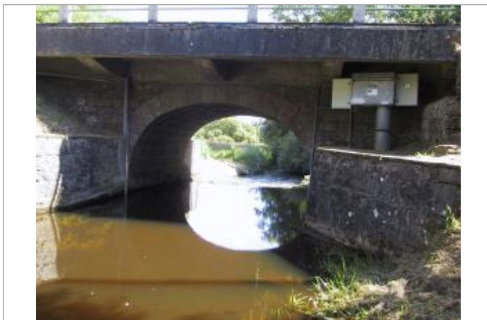
Station hydrométrique du Blavet à Kérien