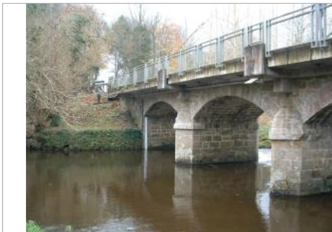
Station hydrométrique du Léguer à Pluzenet-Le Vieux marché