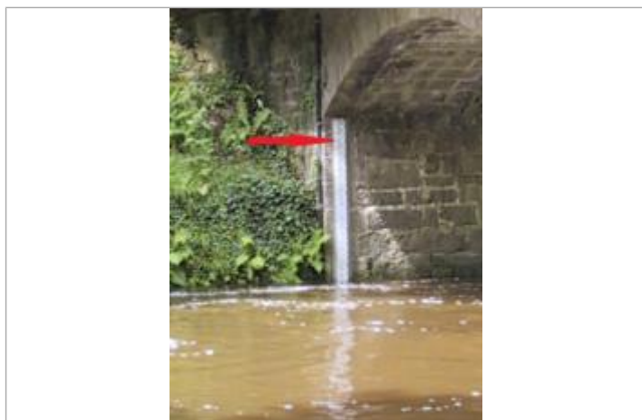
Echelle limnimétrique à la station du Léguer à Pluzenet-Le Vieux Marché

Altitude calculée de l'eau (en m) : 36.19 m