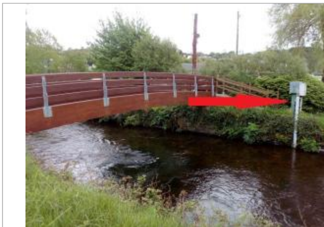
Station hydrométrique du Léguer à Belle-isle-en-terre