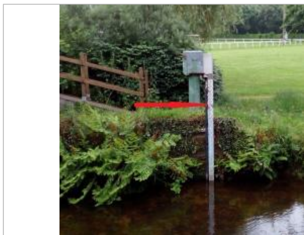
Echelle limnimétrique à la station du Léguer à Belle-isle-en-terre

Différence entre le niveau d'eau et la référence (en m) : 2.330 m