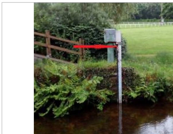
Echelle limnimétrique à la station du Léguer à Belle-isle-en-terre

Différence entre le niveau d'eau et la référence (en m) : 2.950 m