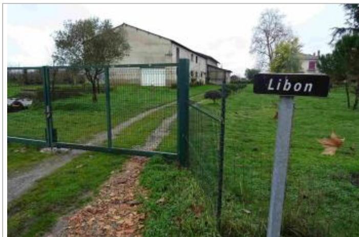
Vue du site - Photo Géosphair

Coordonnées WGS84 : X: 0.19849792 / Y: 44.47132670