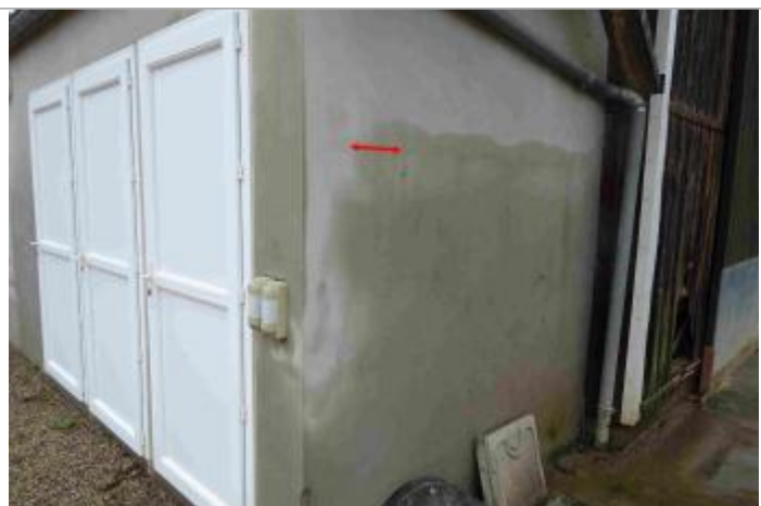
Vue du repère - Photo Géosphair

Altitude calculée de l'eau (en m) : 24.67 m