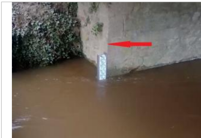
Echelle limnimétrique de la station hydrométrique de Mantallot

Altitude calculée de l'eau (en m) : 21.46 m