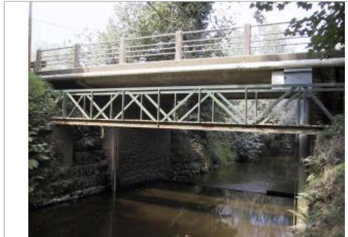
Station hydrométrique du Jaudy à Mantallot

Coordonnées WGS84 : X: -3.27025510 / Y: 48.71385400