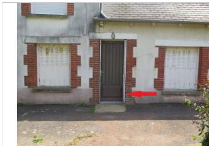
seuil de la porte d'entrée (17/07/2019)

Altitude calculée de l'eau (en m) : 68.47 m