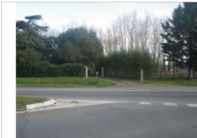
Berge rive gauche

Coordonnées WGS84 : X: 0.34407875 / Y: 44.30408100