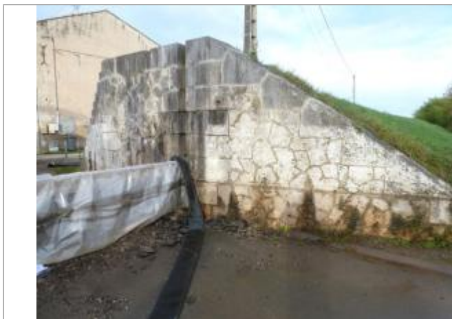
Av. de Lattre de Tassigny