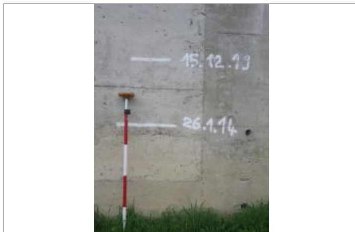
Berge rive droite

Coordonnées WGS84 : X: 0.39764405 / Y: 44.24949100