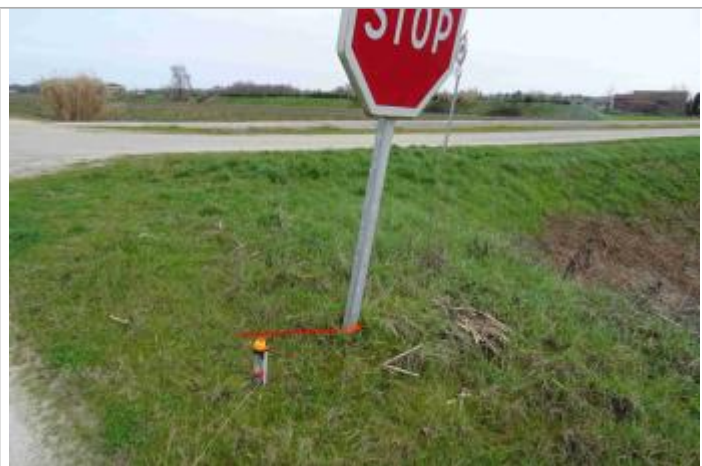
Vue du repère - Photo © GEOSPHAIR

Altitude calculée de l'eau (en m) : 28.26 m