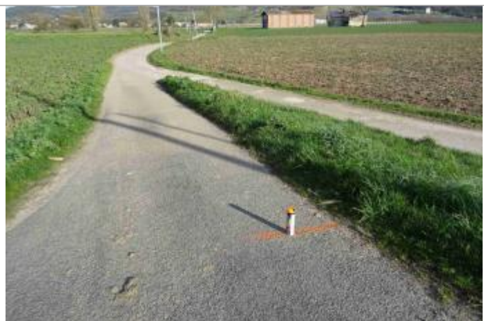
Vue du repère - Photo © GEOSPHAIR

Altitude calculée de l'eau (en m) : 29.51 m