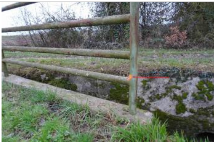
Vue du repère - Photo © GEOSPHAIR

Altitude calculée de l'eau (en m) : 32.72 m