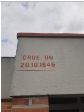
Photo rapprochée du repère