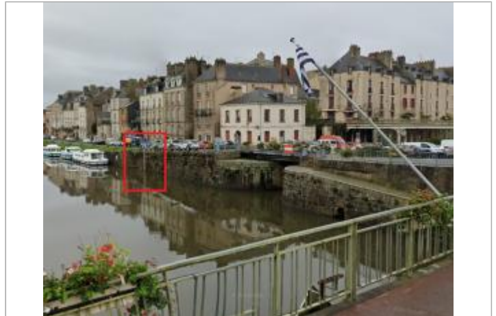
Echelle limnimétrique et confluence Vilaine - Canal de Nantes à Brest