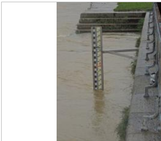
Echelle limnimétrique de la station Vigicrues de Redon Vilaine en crue le 9 février 2014