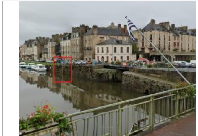
Echelle limnimétrique et confluence Vilaine - Canal de Nantes à Brest