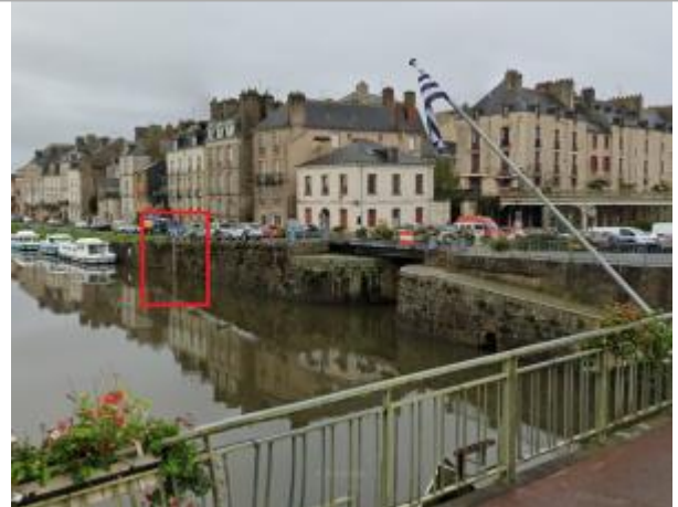
Echelle limnimétrique et confluence Vilaine - Canal de Nantes à Brest